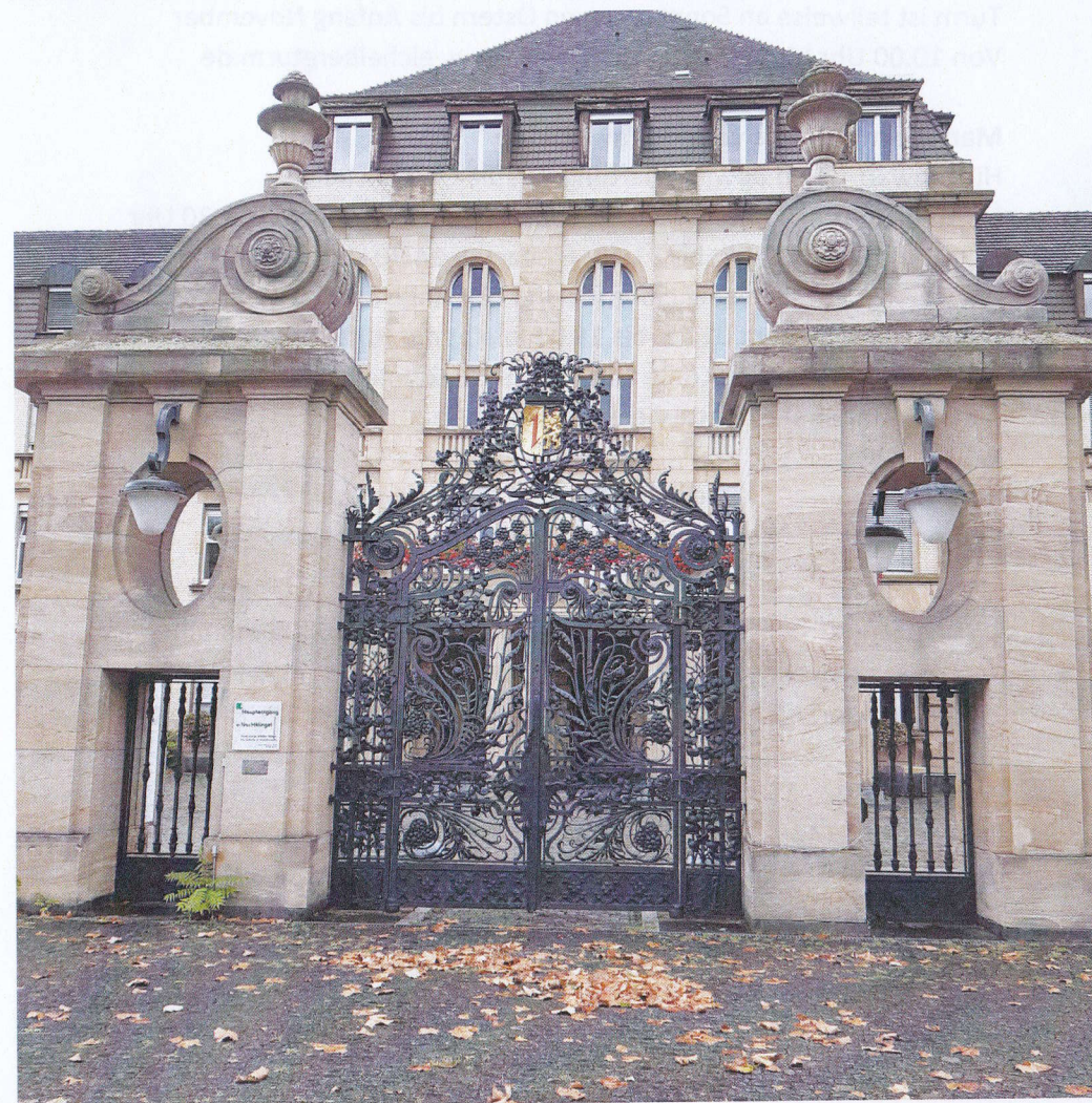
Haupteingang zum Klinikum